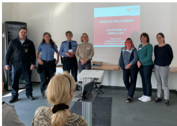
Bild: Die Polizistinnen und Polizisten standen für Fragen der Teilnehmenden zur Verfügung. Die Organisatorinnen freuten sich über die positive Resonanz.

Frau Hoppen wies darauf hin, dass die Zentrale Prävention des Polizeipräsidiums Koblenz auch zu Einbruchsicherheit kostenlose Beratungen im häuslichen Umfeld anbietet.