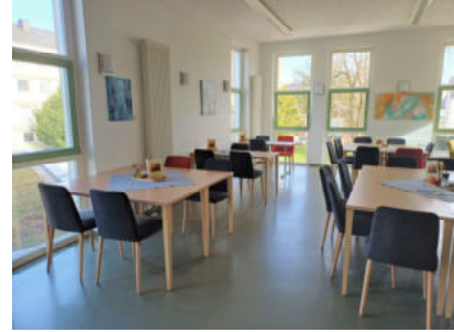
Das Begegnungscafé im Mehrgenerationenhaus